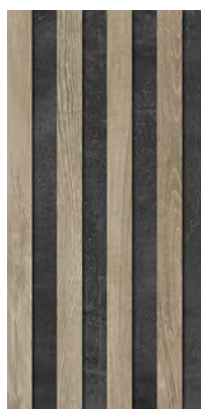
Decor Lodge Brown ELG42 29,4 x 59 cm . 11,6" x 23,2" / E62