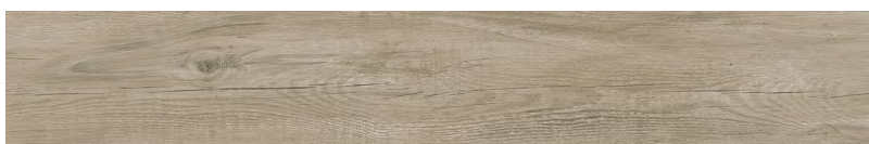
Lodge Brown LG42 19 x 118,2 cm . 7,5" x 46,5" / C10 Lodge Brown Plus LG49 19 x 118,2 cm . 7,5" x 46,5" / C11