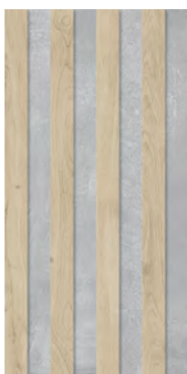
Decor Lodge Beige ELG22 29,4 x 59 cm . 11,6" x 23,2" / E62