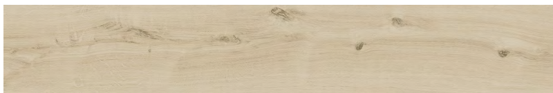
Lodge Beige LG22 19 x 118,2 cm . 7,5" x 46,5" / C10 Lodge Beige Plus LG29 19 x 118,2 cm . 7,5" x 46,5" / C11