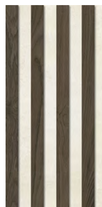
Decor Lodge Dark Brown ELG92 29,4 x 59 cm . 11,6" x 23,2" / E62